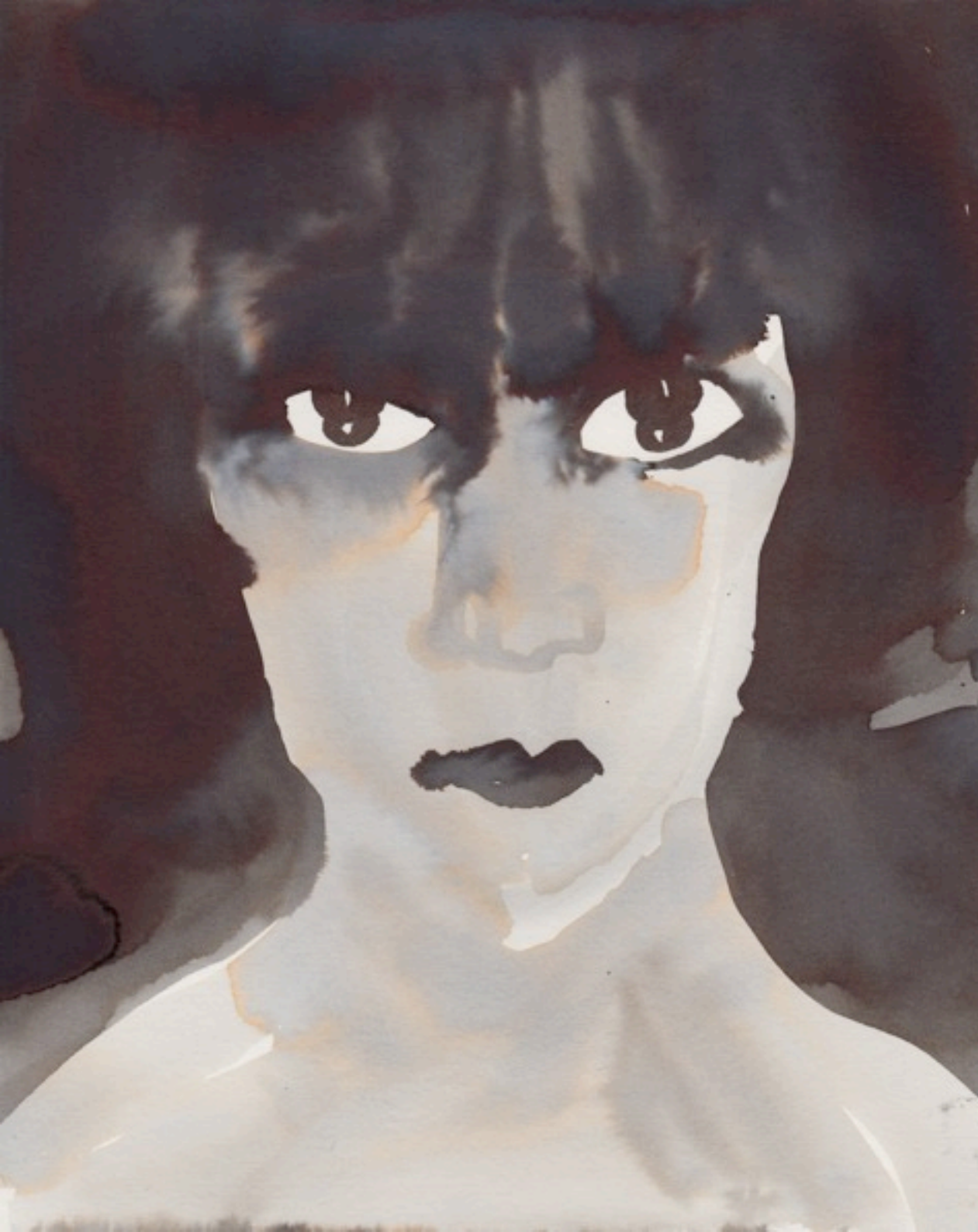
Gill Button La Marquise Casati (D'après une photographie de Man Ray) /The Marchesa Casati (After a Man Ray photograph) 2016 Gouache sur papier, 25x20 cm /Ink wash on paper, 25x20cm unique

Courtesy the artist and Less is More Projects