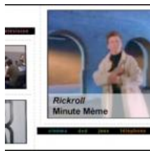
La minute même: la sextape des acteurs de Twilight