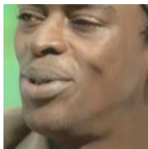
Seu Jorge, Brésil de la tentation