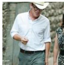
La Playlist: Tame Impala, Maximum Balloon, Yann Tiersen...