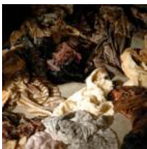
Un défilé à contre-poil