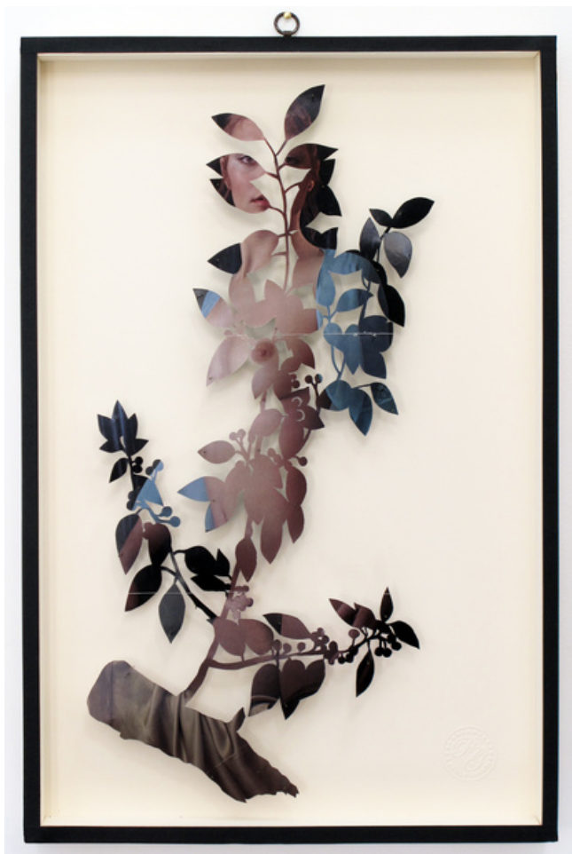
Paolo Giardi, You Can Learn a Lot of Things From the Flowers X / no name — Rhamnus alaternus , L. / Oui, 2011

Page de magazine découpée et épingles pour insectes sur papier