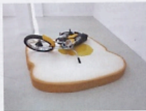
TOAST CANNIBALE, FRANÇOIS CURLET, 2014 MOTO, MOUSSE, RÉSINE, 220 X 200 X 50 CM. PRIX: 45 000 €. DU 23 AU 26 OCTOBRE, GALERIE AIR DE PARIS, FIAC, PARIS.